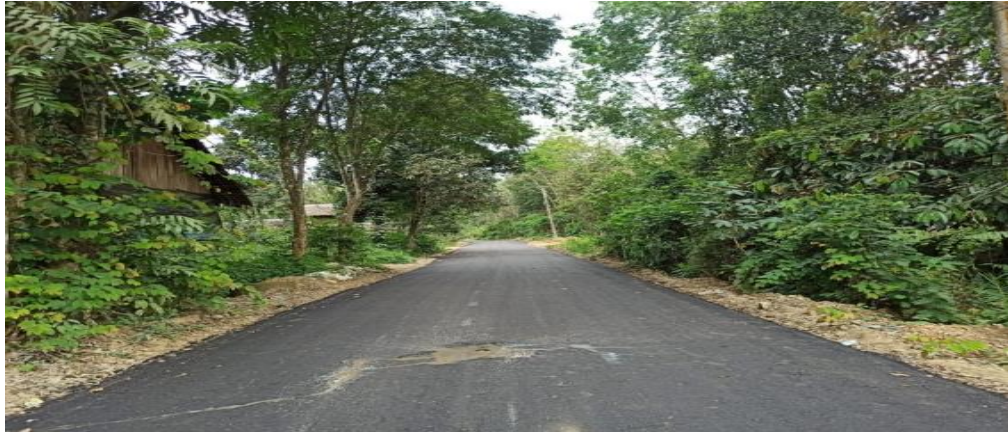
Peningkatan jalan Guha – Mantimin